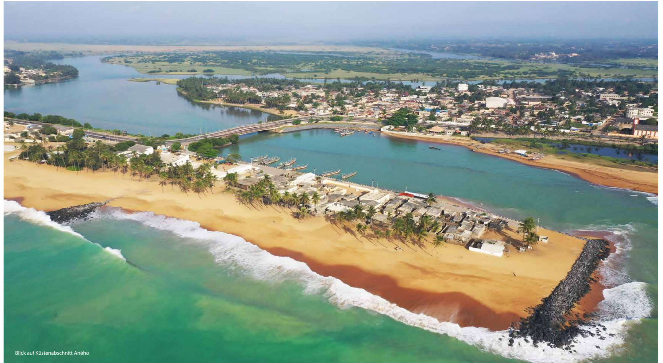
Blick auf Küstenabschnitt Aného

Für die kommenden Jahre sind umfangreiche Investitionen vorgesehen, um den Küstenschutz, die Entwicklung von Erholungsgebieten und eine nachhaltige Fischereiwirtschaft zu unterstützen.